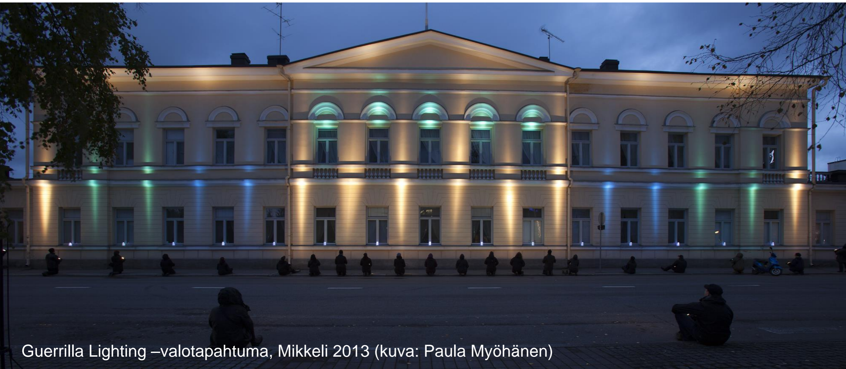
Guerrilla Lighting –valotapahtuma, Mikkeli 2013

Pysyvien paikkasidonnaisten teosten rinnalla lyhytaikaisia, väliaikaisia teoksia ja elinkaarteoksia.