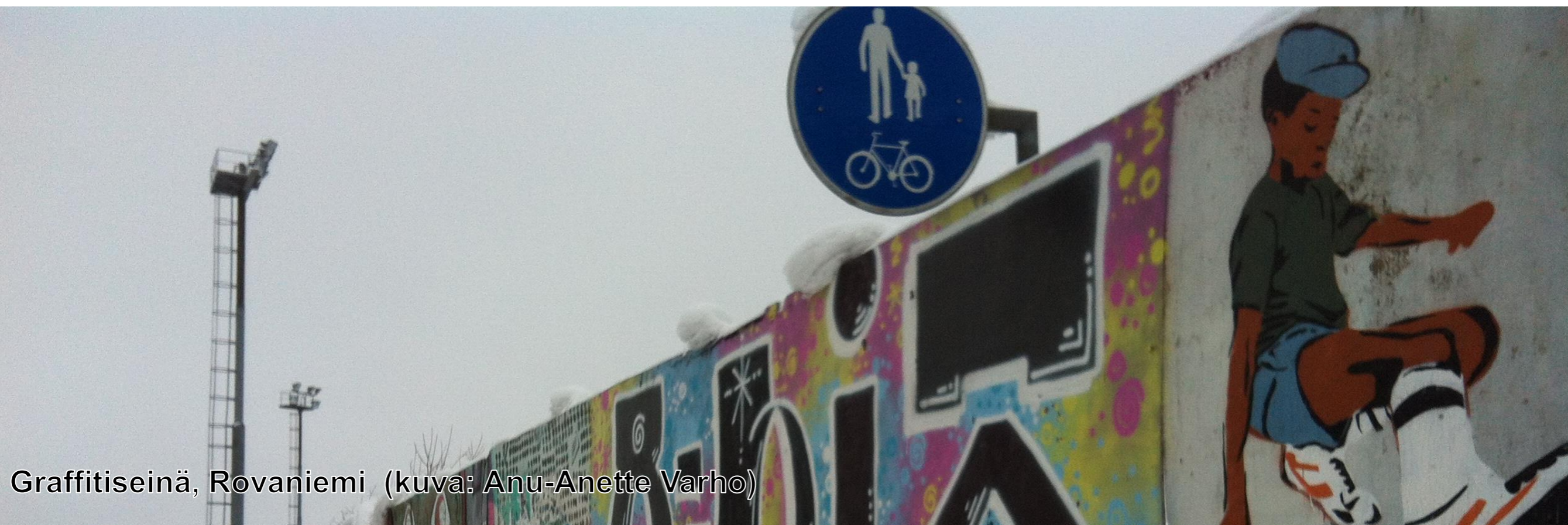
Graffitiseinä, Rovaniemi

Julkisen taiteen ja taiteellisen suunnittelun ottaminen huomioon keskustaa kehitettäessä on merkittävässä roolissa, kun mietitään vetovoimaisuutta ja julkisten paikkojen laadun kohottamista.