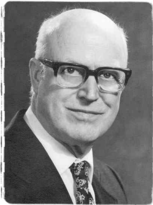
Earl Tupper 1907-1983