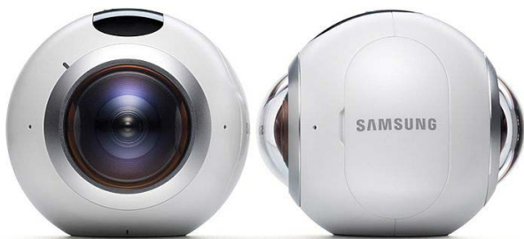
Samsung Gear 360.