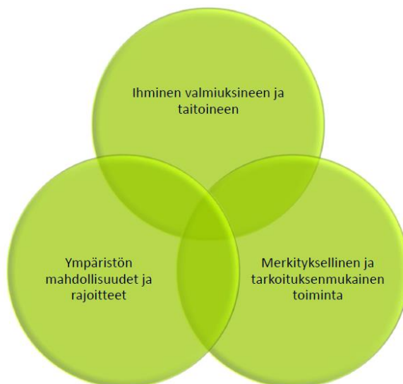
Kuvio 1. Toiminnallisuus keskiössä.

Toiminnallisuus toimintaterapian yläkäsitteenä löytyy kaikista toimintaterapian eri teorioista ja viitekehyksistä. Tässä nimikkeistössä se eritellään toimintakokonaisuuksiin, jotka kuvaavat ihmisen elämän eri toimintoja. Päivityksen yhteydessä toimintakokonaisuuksiin lisättiin ajankäytön hallinta omaksi kokonaisuudekseen. Yhteiskunnallisen toimintaympäristön muuttuessa ajankäytön hallinta on entistä olennaisempi teema asiakkaan toiminnallisuutta arvioitaessa ja toimintaterapian toteutuksessa.