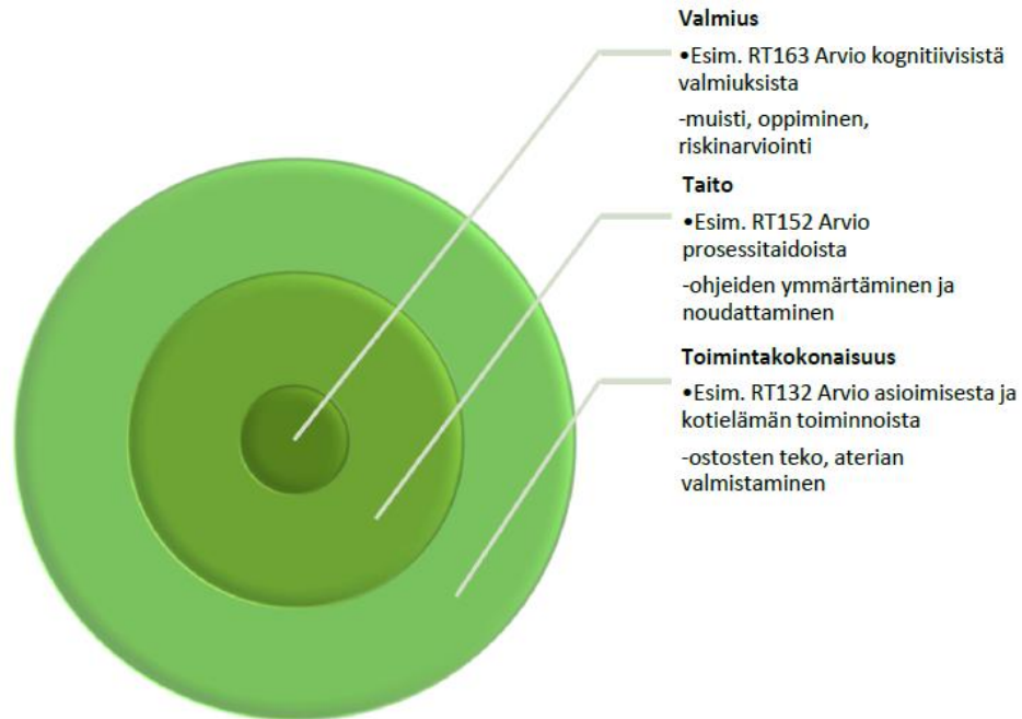
Kuvio 2. Valmiuksien, taitojen ja toimintakokonaisuuksien hierarkia.

Ihmisen ja ympäristön vuorovaikutus on toimintaterapian ydintä. Ympäristö on nimikkeistössä vahvemmin näkyvässä kuin aiemmin. Sen jaottelussa on huomioitu yhteiskunnan monikulttuurisuuden ja teknologian läsnäolo ihmisen arjessa. Ympäristö-alaluokkaan sisällytettiin palvelutarve- sekä apuväline- ja ortoosiasiat. Ne ovat ihmisen toimintaa mahdollistavia tekijöitä.