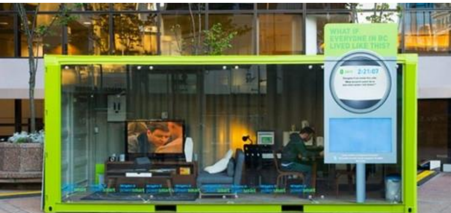
BICYCLE CENTER 2.0